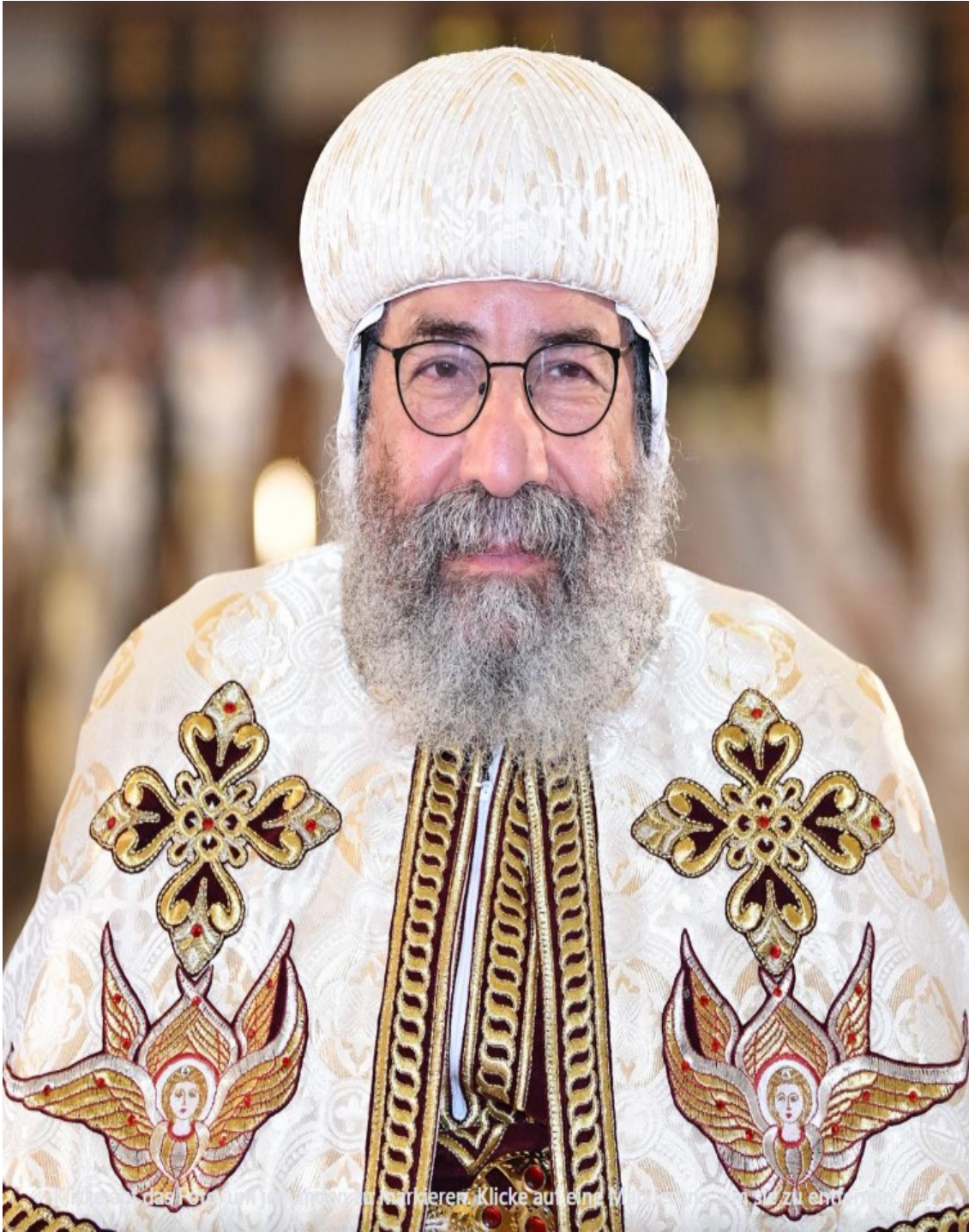
Seine Exzellenz, Bischof Abba Deuscoros, Abt des St.Antonius Klosters in Kröffelbach und Bischof der koptischen Diözese Süddeutschland