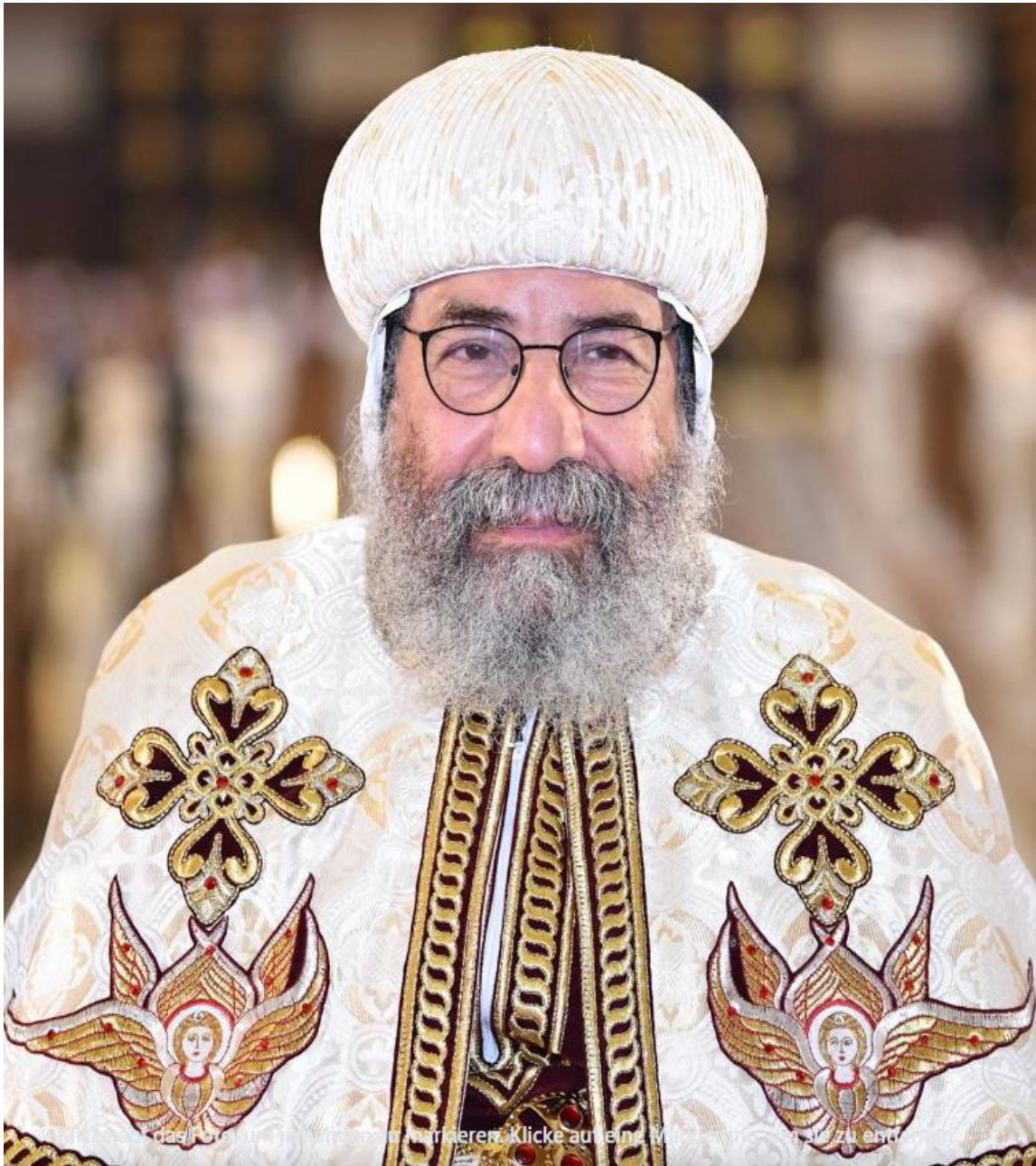
Seine Exzellenz, Bischof Abba Deuscoros, Abt des St.Antonius Klosters in Kröffelbach und Bischof der koptischen Diözese Süddeutschland